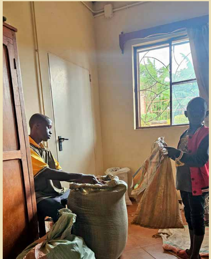
Le attività di distribuzione dei beni presso casa Museke

Molti bambini, attraverso piani seguiti con costanza nei centri di riferimento, hanno iniziato a mostrare una nuova consapevolezza del proprio corpo e dello spazio circostante. Vedere un piccolo raggiungere un equilibrio posturale mai avuto prima o assistere al risveglio di nuove capacità comunicative e di attenzione è stato il segnale più forte che la strada intrapresa era quella corretta. Il vero successo, tuttavia, risiede in un aspetto meno visibile ma fondamentale: la maggiore serenità con cui i bambini hanno vissuto i trattamenti, segno di un benessere che parte dal corpo per arrivare alla qualità complessiva della vita quotidiana.