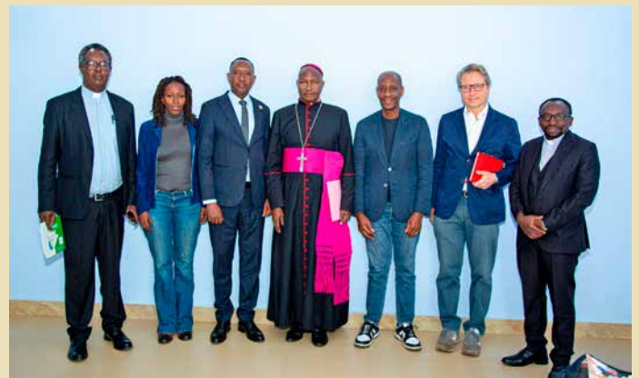
Sopra: l'incontro con il Vescovo

Ogni volta partiamo pensando di portare qualcosa. Ogni volta torniamo avendo ricevuto molto di più.