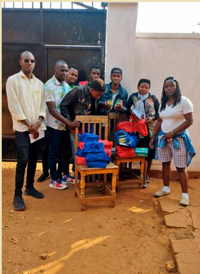
Gli studenti universitari di Museke durante la distribuzione di materiale scolastico ai più piccoli

Étoile Solidaire porta il suo nome con orgoglio: vogliamo essere una luce per i bambini vulnerabili, una stella che illumina il loro cammino verso il successo. Vi invitiamo a unirvi a questa missione, a sostenere la nostra iniziativa e a diventare attori di questo cambiamento. Insieme, facciamo brillare ancora di più le stelle. Grazie per l'attenzione.