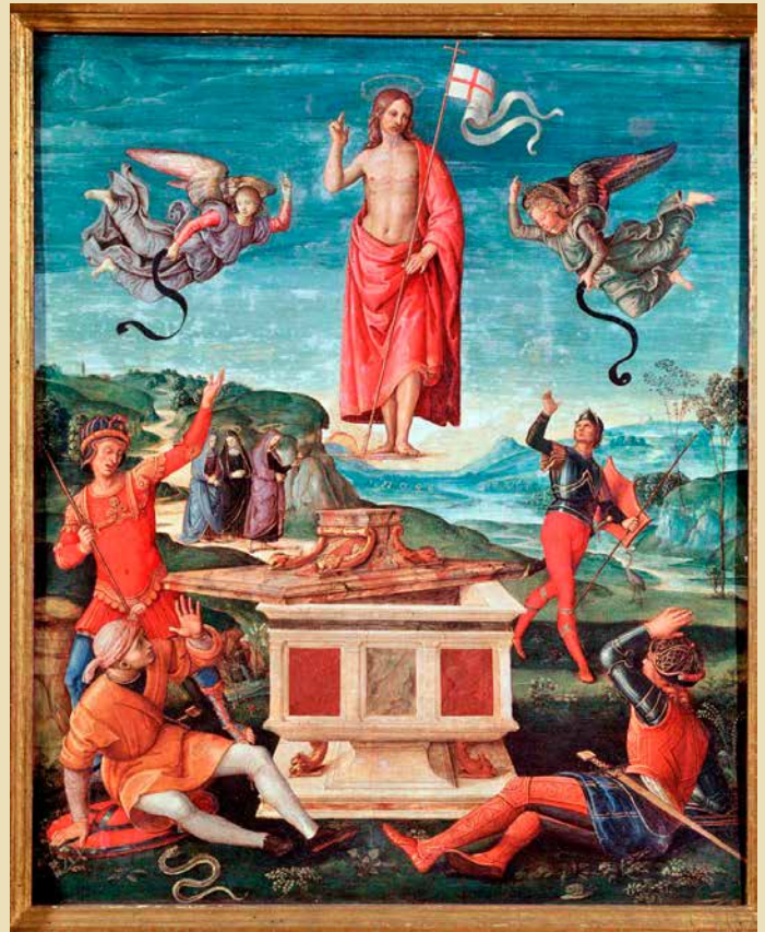
Raffaello Sanzio, Resurrezione di Cristo, 1502

"Il logo di Museke rappresenta due mani che si intrecciano per formare una colomba. È il nostro modo di dire che la pace non è un'idea astratta, ma qualcosa che costruiamo insieme, giorno dopo giorno, con il lavoro delle nostre mani.