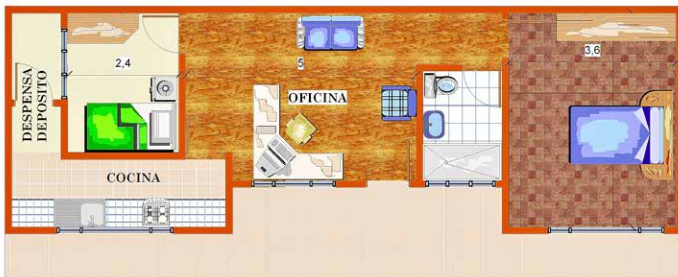
PLANTA BAJA FUNCION ACTUAL